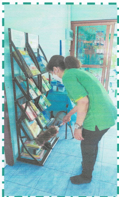
ภาพก่อนทำกิจกรรม